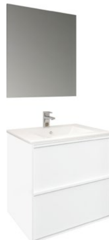
Conjunto FRAME 60 x 46 cm blanco mate

Con espejo TEC 60x80 cm A CONJU992 | 420,00€