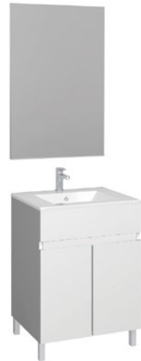
Conjunto MATTY 60 x 39 cm blanco brillo

Con espejo liso 50x80 cm A CONJU559 | 235,50€