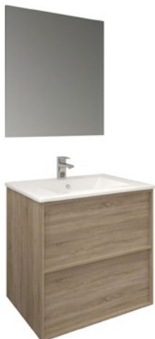
Conjunto FRAME 60 x 46 cm roble natural

Con espejo TEC 60x80 cm A CONJU992 | 420,00€