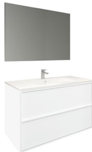
Conjunto FRAME 100 x 46 cm blanco mate

Con espejo CAN 100x80 cm A CONJU996 | 540,00€