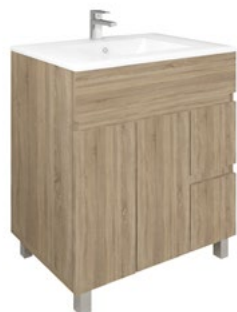
Conjunto MATTY 70 x 46 cm roble Cambrian

Con espejo liso 70x70 cm A CONJU497 | 269,95 €