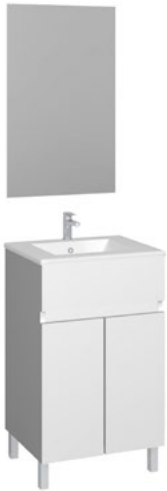
Conjunto MATTY 50 x 39 cm blanco brillo

Con espejo liso 50x80 cm A CONJU559 | 235,50€