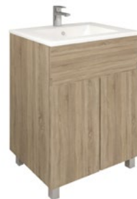
Conjunto MATTY 60 x 39 cm roble Cambrian

Con espejo liso 60x80 cm A CONJU495 | 239,95 €