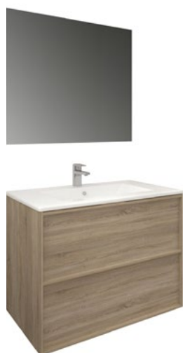
Conjunto FRAME 80 x 46 cm roble natural

Con espejo TEC 60x80 cm A CONJU993 | 499,00€