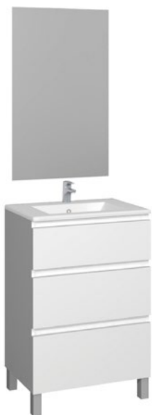
Conjunto MANNING 60 x 39 cm roble Cambrian

Con espejo liso 60 x 80 cm A CONJU563 | 350,00 €