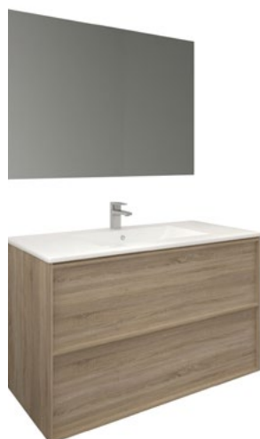
Conjunto FRAME 100 x 46 cm roble natural

Con espejo MADISON 80x80 cm A CONJU994 | 510,00€