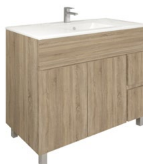
Conjunto MATTY 100 x 46 cm roble Cambrian

Con espejo liso 100x80 cm A CONJU501 | 349,95 €