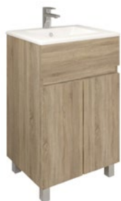
Conjunto MATTY 50 x 39 cm roble Cambrian

Con espejo liso 50x80 cm A CONJU560 | 235,50 €