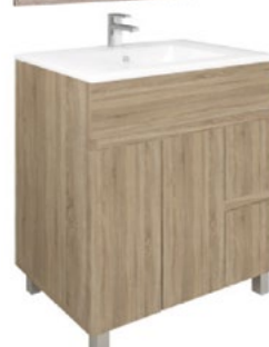
Conjunto MATTY 80 x 46 cm roble Cambrian

Con espejo liso 80x80 cm A CONJU499 | 269,95 €