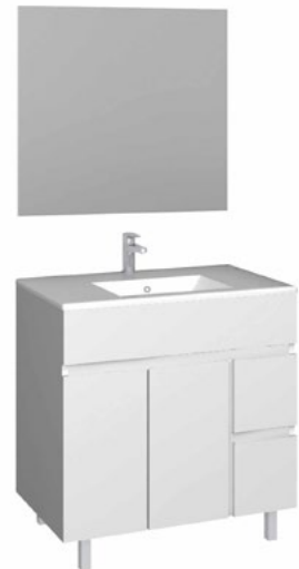
Conjunto MATTY 80 x 46 cm blanco brillo

Con espejo liso 70x70 cm A CONJU496 | 269,95€