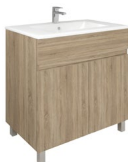
Conjunto MATTY 80 x 46 cm roble Cambrian

Con espejo liso 80x80 cm A CONJU593 | 240,00 €