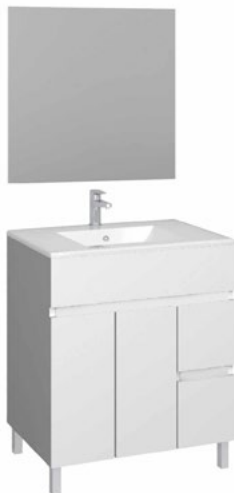
Conjunto MATTY 70 x 46 cm blanco brillo

Con espejo liso 60x80 cm A CONJU494 | 239,95€