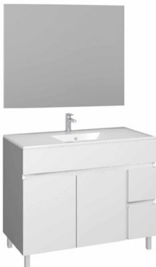
Conjunto MATTY 100 x 46 cm blanco brillo

Con espejo liso 80x80 cm A CONJU498 | 279,95€