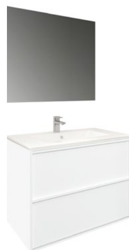
Conjunto FRAME 80 x 46 cm blanco mate

Con espejo MADISON 80x80 cm A CONJU994 | 469,00€